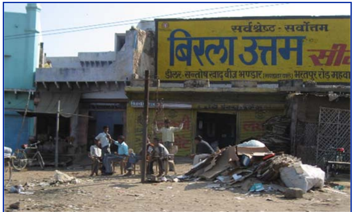
Fotografia autorska, Indie 2007

http://www.ted.com/talks/lang/en/paul_zak_trust_morality_and_oxytocin.html